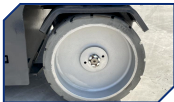
ШИНЫ НЕ ПАЧКАЮЩИЕ ПОЛ