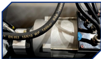
ДВИГАТЕЛЬ ПЕРЕМЕННОГО ТОКА