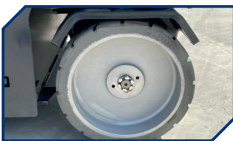
ШИНЫ НЕ ПАЧКАЮЩИЕ ПОЛ