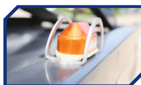
ОПТИКО-АКУСТИЧЕСКИЕ СИГНАЛЬНЫЕ ОГНИ