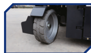
СИСТЕМА РУЛЕВОГО УПРАВЛЕНИЯ