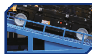
МАКСИМАЛЬНЫЙ НАКЛОН 30°