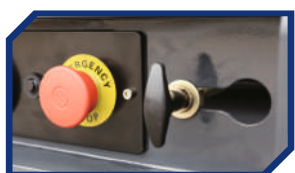
СИСТЕМА АВАРИЙНОГО ОПУСКАНИЯ